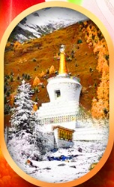
อุทยานสี่ตุ๋น