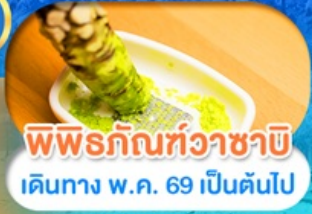
พิพิธภัณฑที่วาซาบิ เดินทาง พ.ศ. 69 เป็นต้นไป