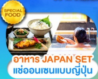
อาหาร JAPAN SET แช่ออนเซนแบบญี่ปุ่น