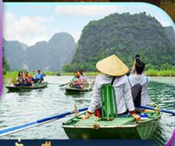
นั่งเรือกระจาด