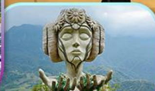
Moana Sapa Cafe