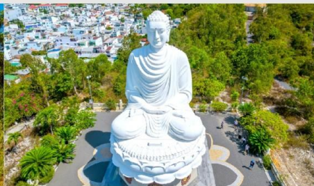
วัดลองเซิน