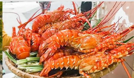
Nha Trang Night Market

*ทางบริษัทฯ ขอสงวนสิทธิ์ในการสลับโปรแกรมทัวร์ตามความเหมาะสมขึ้นอยู่กับสถานการณ์หน้างาน โดยคำนึงถึงผลประโยชน์ของลูกค้าเป็นสำคัญ