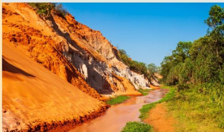
ลำธารนางฟ้า