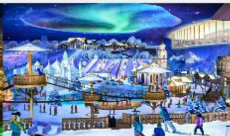
ICE AND SNOW WORLD