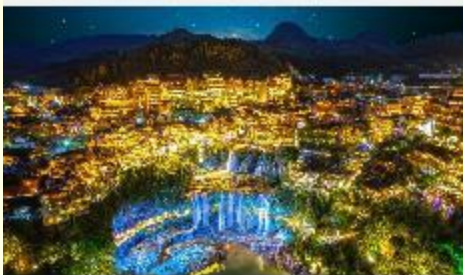
ฝูหรงเจิน