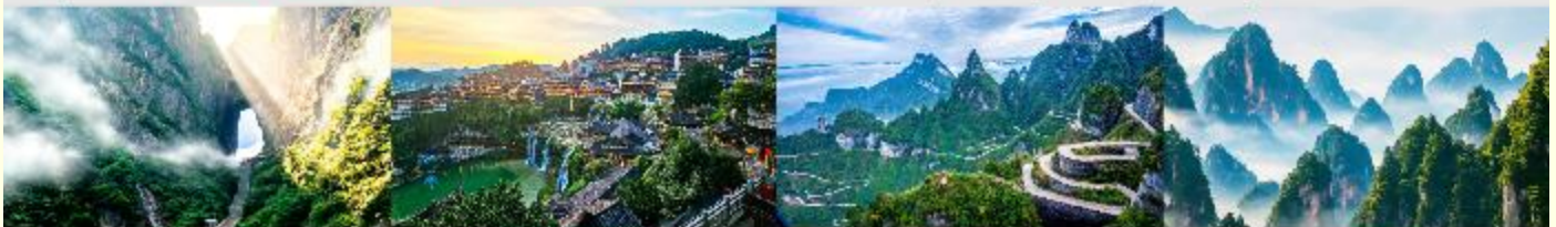
ประตูลั่วสวรงค์