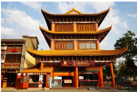
เมืองโบราณกวนตุ๋

พักที่ REGENT HOTEL ระดับ 4 ดาว หรือเทียบเท่าในเมืองต้าหลี่