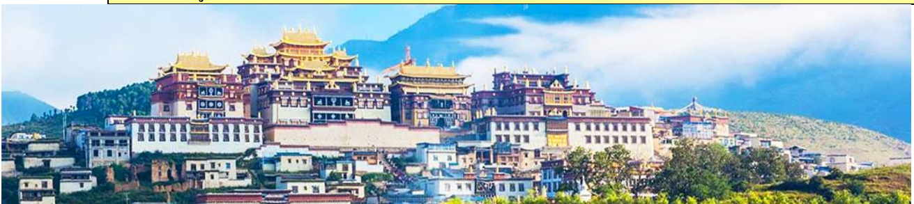
เมืองโบราณแขวงกาลีล่า

หมายเหตุ การเที่ยวชมอุทยานช่องแคบเสือกระโจน สามารถเที่ยวได้ด้วยการเดินลง และขึ้นบันไดจากบริเวณลานจอดรถลงไปยังจุดชมวิวกว้างริมแม่น้ำที่อยู่ด้านล่าง (บันไดราว 430 ขั้น) หรือท่านสามารถซื้อตั๋วบันไดเลื่อนในราคา 70 -100 หยวนรวมขาลงและขาขึ้น ( โดยราคา 70 หยวนจะมีเฉพาะช่วงที่มีโปรแกรมขึ้นเท่านั้น) ค่าทัวร์ของเราได้รวมค่าเข้าชมอุทยานเสือกระโจน แต่ยังไม่รวมค่าบันไดเลื่อน หากท่านต้องการซื้อตั๋วบันไดเลื่อน ท่านสามารถแจ้งความประสงค์กับไกด์ท้องถิ่นเพื่อให้ไกด์ดำเนินการจองตั๋วแบบหมู่คณะล่วงหน้า