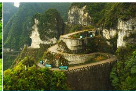
เส้นทาง 99 โค้ง

จากนั้นนำท่านสู่ โพรงประตูสวรรค์ 天门洞 โดย บันไดเลื่อนที่สร้างขึ้นโดยการเจาะทะลุภูเขา 穿山手扶梯 มีความสูงถึง 7 ชั้น เป็นสิ่งอำนวยความสะดวกใหม่ล่าสุดของ เขาเทียนเหมิน ซึ่งหาดูได้ยากตามแหล่งท่องเที่ยวต่างๆ ทั่วโลก บริเวณนี้ ท่านจะได้ถ่ายภาพ ประตูสวรรค์ อย่างใกล้ชิด โดยในปี 1990 มีนักบินผาดโผนชาวรัสเซียขับเครื่องบิน 3 ลำบินลอดผ่านช่องโพรงหินประตูสวรรค์แห่งนี้พร้อมกัน ภาพประวัติศาสตร์นี้ถูกบันทึก