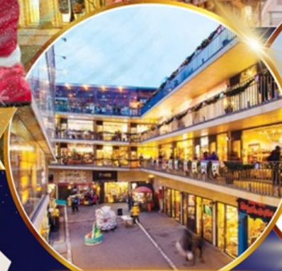
ถนนช้อปปิ้งอินชาง