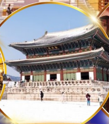
พระราชวังเคียงบกกุง