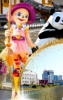
มหาลัยหญิงอีวา