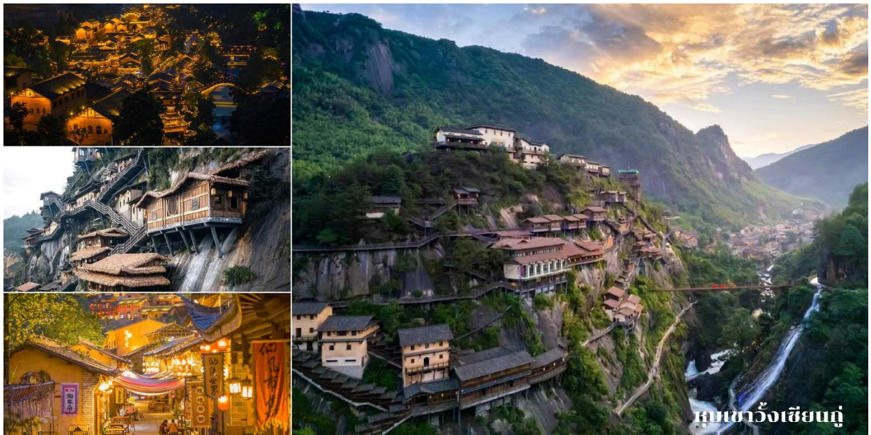
หมู่บ้านอิงเซียนถู่

ที่พัก Shangrao jialaite Hotel 4* หรือเทียบเท่า