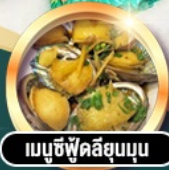
เมนูซีฟู้ดลิขุนบน