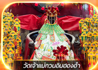
วัดเจ้าแม่ทวนอิมของซ่า