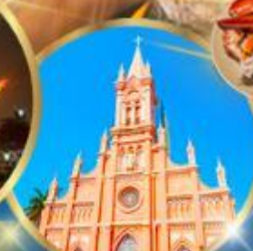
โบสถ์สิชมพู่