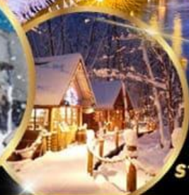
หมู่บ้านเทพนิยาย นิงเกิลเทอเรส