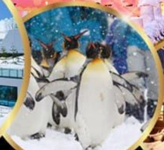
สวนสัตว์ อาซาฮิยาม่า