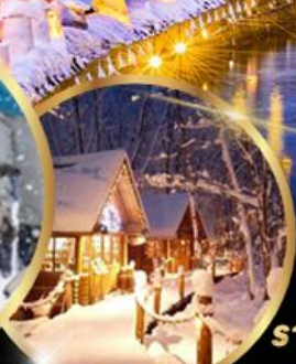
หมู่บ้านเทพนิยาย นิงเกิ้ลเทอร์ส