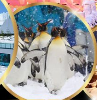
สวนสัตว์ อาซาฮิยาม่า