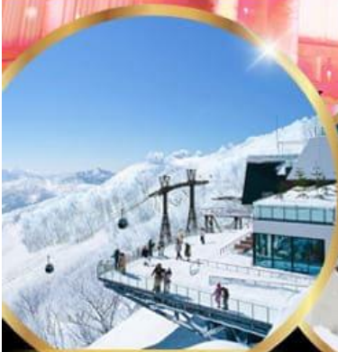
จุดชมวิวก Unkai Terrace