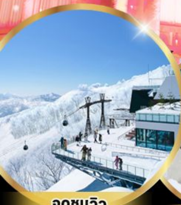
จุดชมวิว Unkai Terrace