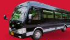
BUS (10-18 ท่าน)