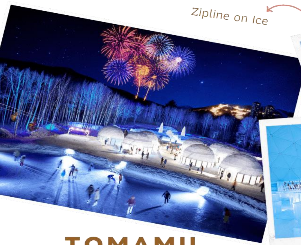
Zipline on Ice

ระยะทางประมาณ 60 เมตร ระหว่างทางคุณจะได้ชื่นชมทิวทัศน์ของหิมะ และลานน้ำแข็งที่น่าอัศจรรย์ Ice Bakery & Cafe คาเฟ่ที่ให้บริการเครื่องดื่มร้อน และขนม ที่ให้ท่านนั่งทานบนโต๊ะและเก้าอี้น้ำแข็ง Ice Bar บาร์ที่บริการเครื่องดื่มประเภทค็อกเทล และเครื่องดื่มแอลกอฮอล์อื่นๆ หลายชนิด ที่เสิร์ฟใน แก้วน้ำแข็งสวยๆ เป็นต้น (**ราคาทัวร์ไม่รวมค่ากิจกรรมและค่าเครื่องดื่ม Ice Bar, Ice Bakery&Cafe**)