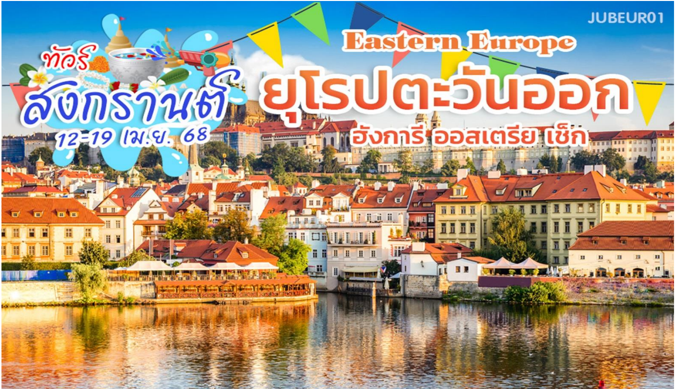
สะพานชาร์ลส์