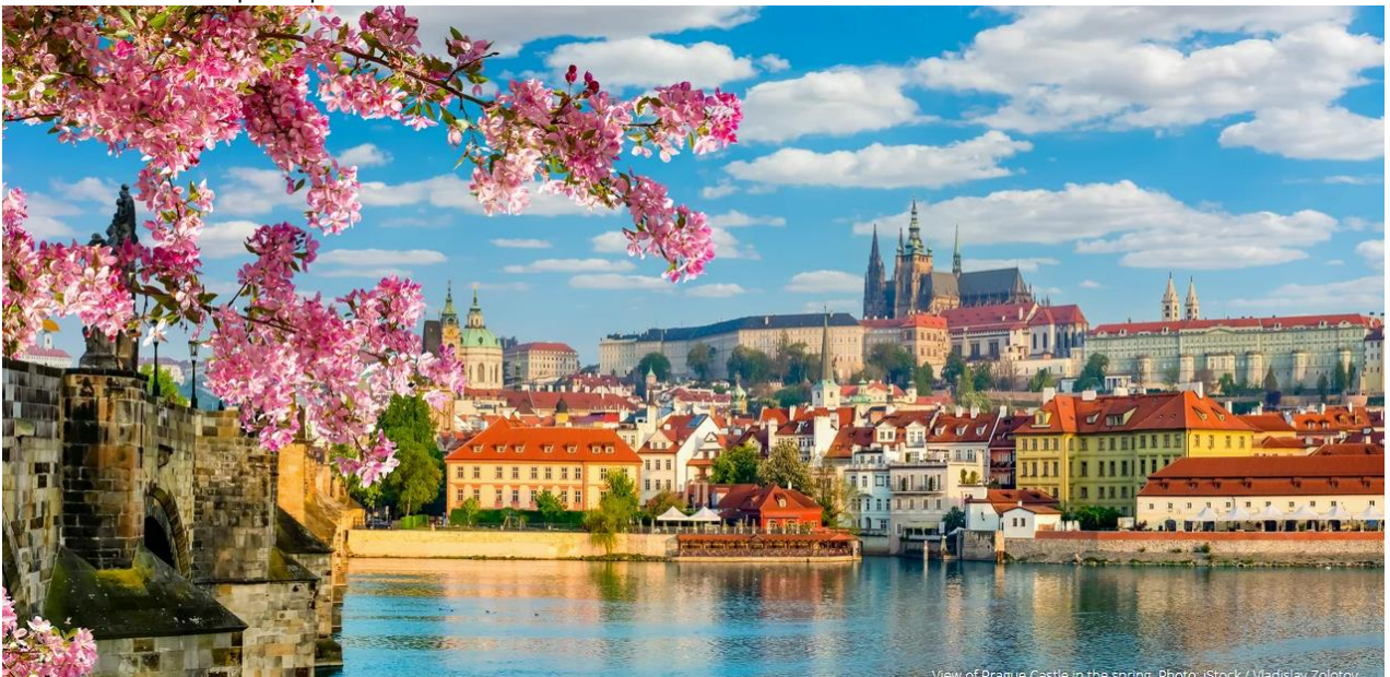
View of Prague Castle in the spring.

เที่ยง บ่าย 📍 รับประทานอาหารกลางวัน ณ ภัตตาคารอาหารพื้นเมือง ออกเดินทางสู่ กรุงปราก (PRAGUE) เมืองหลวงของสาธารณรัฐเช็ก ความโดดเด่นและความงามเรียบง่ายของเมืองเก่าแก่ เมื่อ ค.ศ. 1992 องค์การยูเนสโกได้ประกาศให้ปราก เป็นมรดกโลก มีแม่น้ำวัลตาวา (VLTAVA) ไหลผ่านกรุงปรากจึงมีสะพานที่ทอดข้ามแม่น้ำวัลตาวาอยู่หลายแห่งเป็นจุดหมายในการท่องเที่ยวที่ได้รับความนิยมมากที่สุดในยุโรป