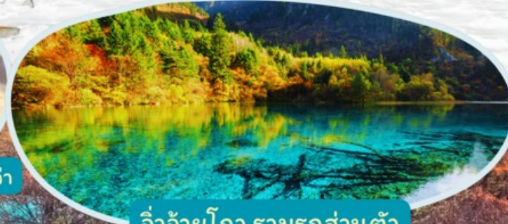
จิวจ้ายโกว รวมรถส่วนตัว