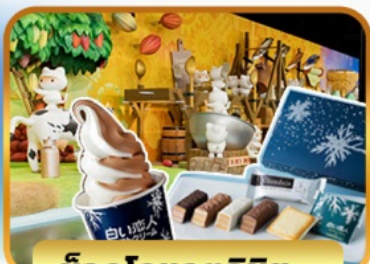
ช็อกโกแลตชิช: