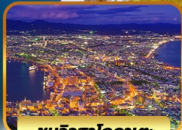
ชมวิวฮาโกดาเตะ

SPECIAL PROMO จอง 10 ท่านแรก ลด 2,000 บาท