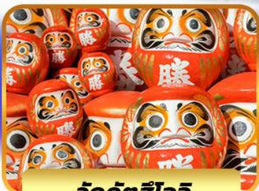
วัดคัตสึโองิ