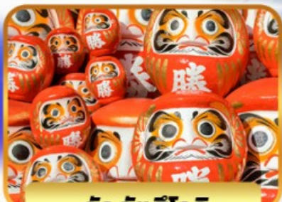
วัดคัตสึโงะ