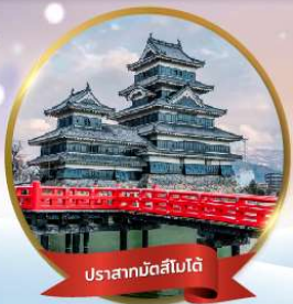
ปราสาทมัตสึโมโต้