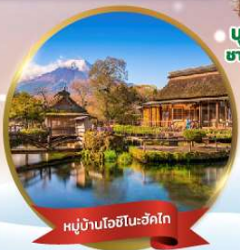
หมู่บ้านโอชิโนะฮักไก