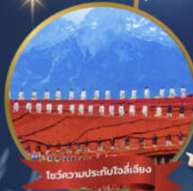
โซ่วความประทับใจลี่เจียง