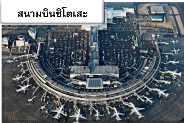
สนามบินชิตเสะ

เวลา 01.20 น. ออกเดินทางสู่ สนามบินชิตเสะ ประเทศ ญี่ปุ่น โดย สายการบินไทยแอร์เอเชีย เอ็กซ์ เที่ยวบินที่ XJ 620