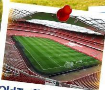
Old Trafford Stadium