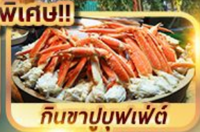
กินชาบูบุฟเฟ่ต์