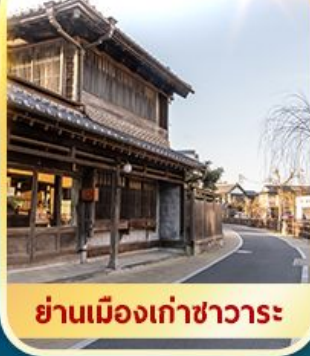
ย่านเมืองเก่าซาวาระ