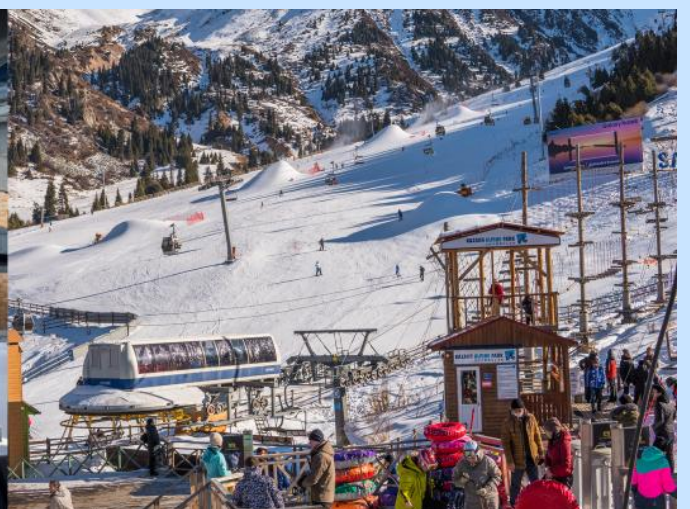
Shymbulak Ski Resort