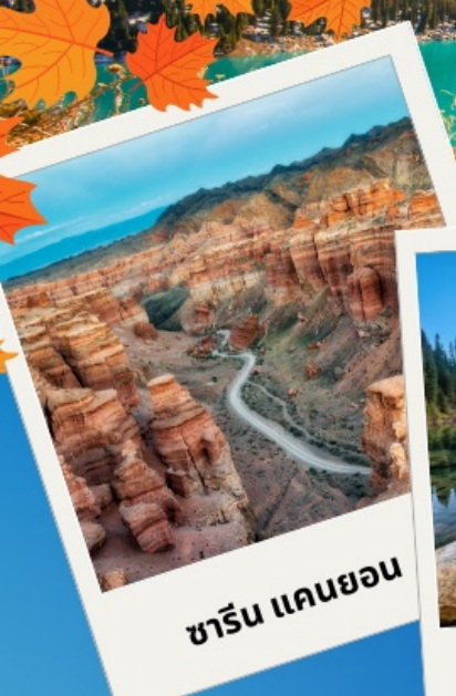
ชาริน แคนยอน