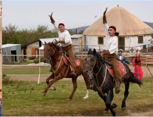
จากนั้น นำท่าน