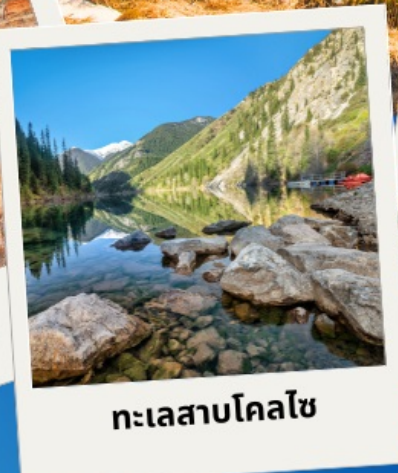
ทะเลสาบโคลไซ