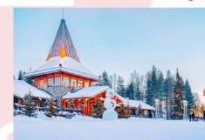
หมู่บ้านซานต้าครอส

15.25 น. ออกเดินทางสู่อิสตันบูล ประเทศตุรกี เที่ยวบินที่ TK 1750 21.10 น. เดินทางถึงสนามบินอิสตันบูล (แวะเปลี่ยนเครื่อง)