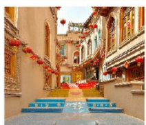
เมืองโบราณคิซาร์