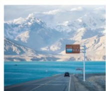
ทะเลสาบไต้ซางู