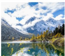
ปี้ฝิงโกว