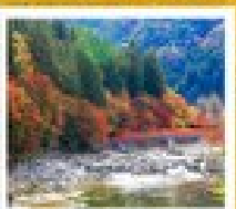
หิราคาว่า

อาอุมิเบย์ / ฮอนชู / สวนทามะฮาน่า / 50ฟุคุงุ / 50ฟุโนมิชิ / ปราสาทโทโทนา / โอซากะ / หิราคาว่า / ภูเขาฟูจิ โถงน้ำ อิกุชิ / สวนโตะชิมะ / ฮอนเม็งฮิรุรุ / 50อาซากุสะ / ฮอนเมะ พลาซ่า