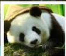
ศูนย์อนุรักษ์แพนด้า