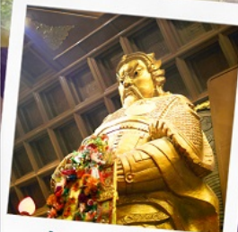
วัดเขาภกษิมิว