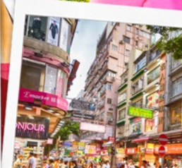
ช้อปปิ้งย่านมงก๊ก