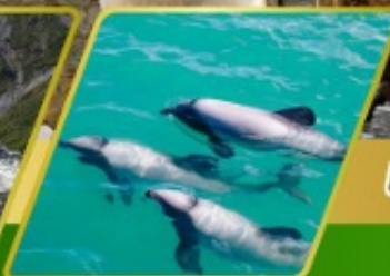
ส่องเรือชมโลมา