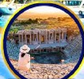
นครเอเฟซัส