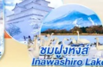
ชมฝูงหงส์ Inawashiro Lake