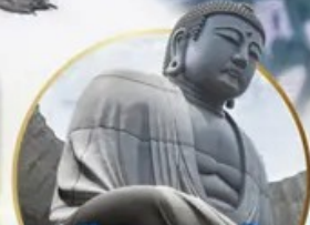
ชมเนินพระพุทธรเจ้า.. Hill of the Buddha

📍 ไฮไลท์!! สนุกสนานกับกิจกรรมทะเลหิมะ ณ ลานสโนว์ เวิลด์ ฮักไซฟาโนรามา เยี่ยมชมเนินพระพุทธรเจ้า ชมความน่ารักเหล่าสัตว์ ณ สวนสัตว์อาซาฮิยาม่า ชมคลองโอดารุ เข้าชมพิพิธภัณฑ์ทักสโงดดนตรี สัมรสราเมง ณ หมู่บ้านราเมนอาซาฮิคาว่า ช้อปปิ้งจุใจ กาบุกุโคจิ อีมอร์รอย!! บุปเฟ่ต์ซาบุมุ และซาบูยักนิ