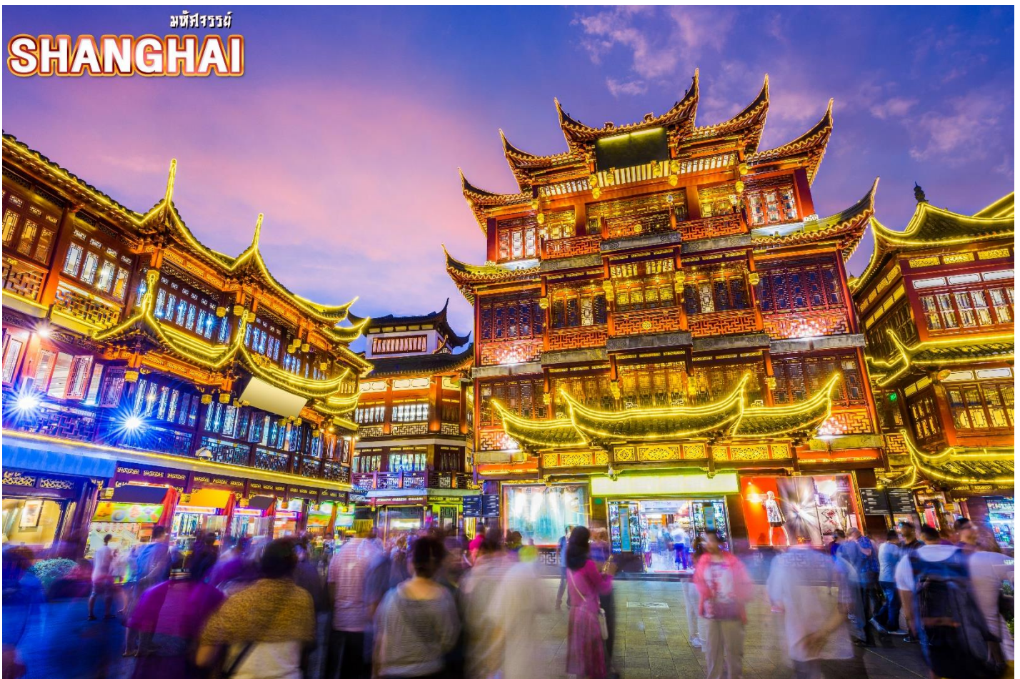
จากนั้น ชมบรรยากาศของ ตลาดร้อยปีเจินหวังเหมียว ตลาดที่เก่าแก่ของเมืองเซี่ยงไฮ้ อาคารบ้านเรือนบริเวณนี้ มีสไตล์สถาปัตยกรรมแบบจีนโบราณที่ยังคงความงดงามเอาไว้ ทั้งร้านขายอาหาร ร้าน