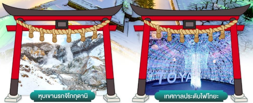
หุบเขานรกจิกุกุดานิ