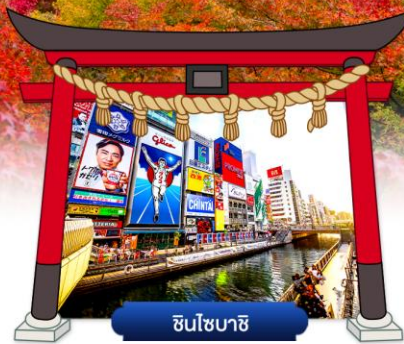
ชินโซบาชิ