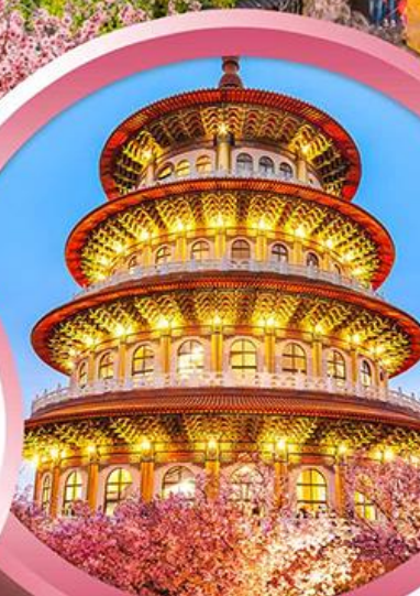
วัดจู้เทียนหยวน

ช้อปปิ้งจุใจ ย่านซีเหมินติง ตลาดไทจงไนท์มาร์เก็ต อัมม่อร้อยกับ..เมนูปลาประรานาธิบติ ชาบูบุฟเฟ่ต์สไตล์ไต้หวัน เสียวหลงเปา