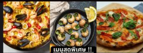
PAELLA ข้าวผัดสเปน / หอยแอสคาโก้ / พิซซ่ามาการิตต้า