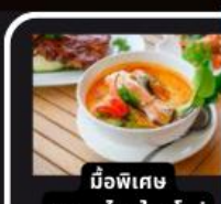
มือพิเศษ อาหารไทยในยุโรป