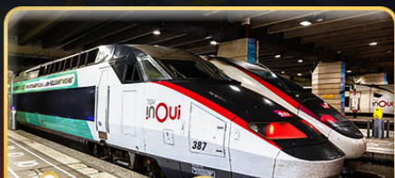
นั่งรถไฟความเร็วสูง 2 เส้นทาง PARIS - LYON & VENICE - ROME

📅 เดินทาง : 11-20 ก.พ. 68 / 15-24 มี.ค. 68 05-14 เม.ย. 68 / 29-08 พ.ค. 68