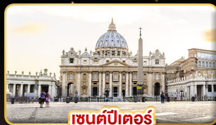
เซนต์ปีเตอร์