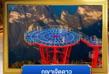
ภูเขาเจ็ดดาว