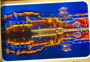
Oriental Salt Lake City