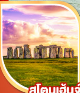
สโตนเฮนจ์