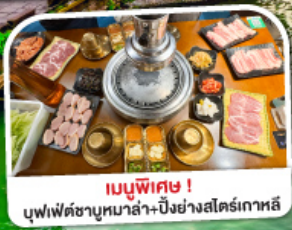
เมนูพิเศษ! บุฟเฟ่ต์ชาบูหม่าล่า+ปิ้งย่างสไตล์เกาหลี