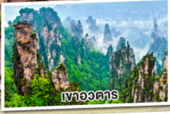
เทาอวตาร