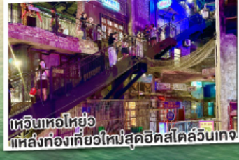
เทวอินหอไหย่ แหล่งท่องเที่ยวใหม่สุดฮิตสไตล์ลูนเทจ