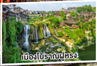
เมืองโบราณฟูหรง