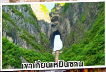
เทวเทียนเหมินซาน