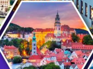
เซสกีครุมลอฟ