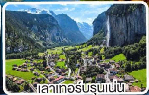
ลาเทอรับรุเนน