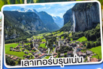
เลาเกอร์บรุนเนน