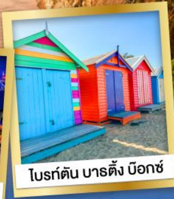
โบสถ์ต้น บาร์ตัง บ็อกซ์