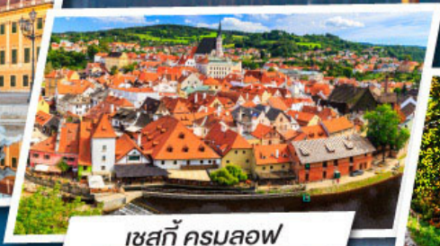
เชสกี ครุมลอฟ